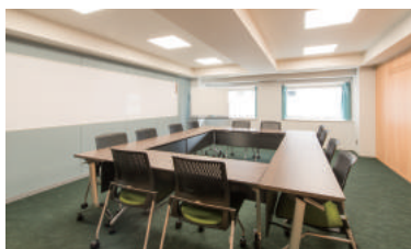
小規模40㎡ / 最大24名

各種備品も取り揃えております ホワイエには無料のコーヒーマシンもご用意しております。