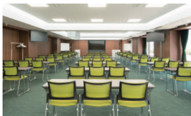
大規模200㎡ / 最大180名