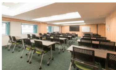
中規模85㎡ / 最大42名